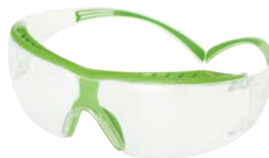
3M™ セキュアフィット™ 保護めがね クリア SF401XSGAF-GRN