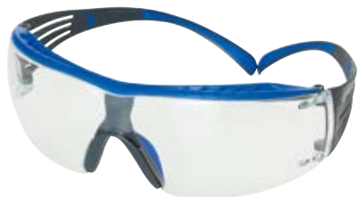
3M™ セキュアフィット™ 保護めがね クリア SF401XSGAF-BLU