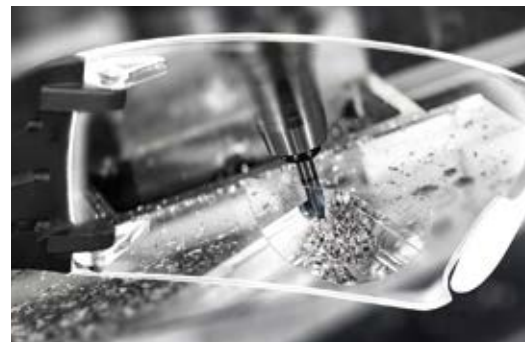
レンズのルーペ部分、拡大イメージ。